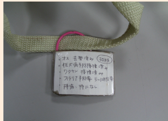
ペット用備蓄品保管袋に付けられた個体情報の例