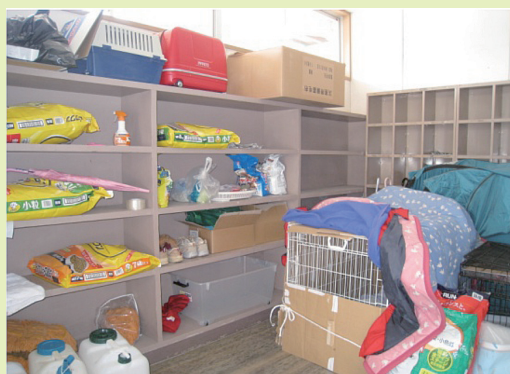
屋内で飼育している様子（岩手県南地域）