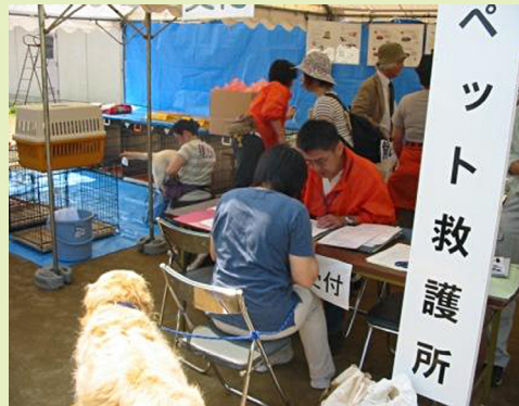
防災訓練におけるペット同行避難訓練の様子（仙台市）