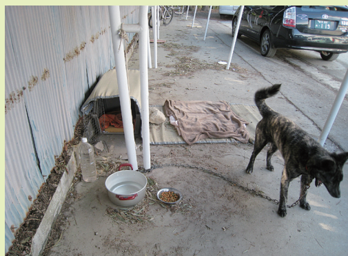
ペット専用係留所で飼育されている様子（岩手県）