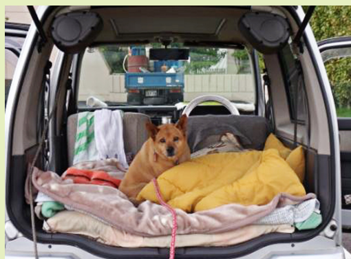
ペットとの車中泊（仙台市）