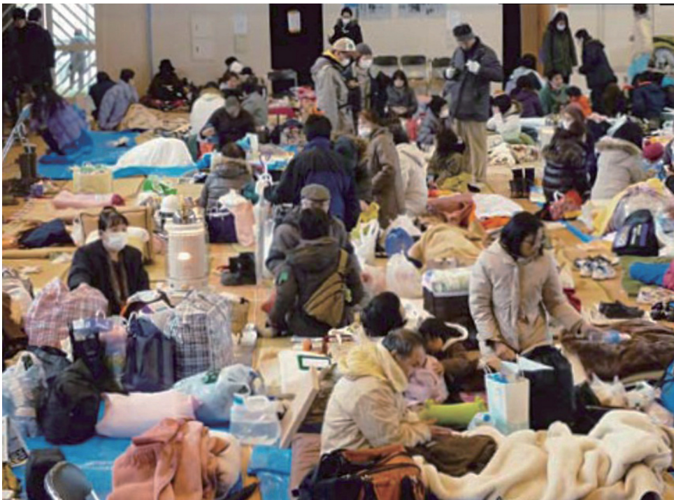
避難所では、周りの人への配慮が必要

また、ペットは、ストレスから体調を崩したり、病気が発生しやすくなるため、飼い主はペットの体調に気を配り、不安を取り除くように努める。