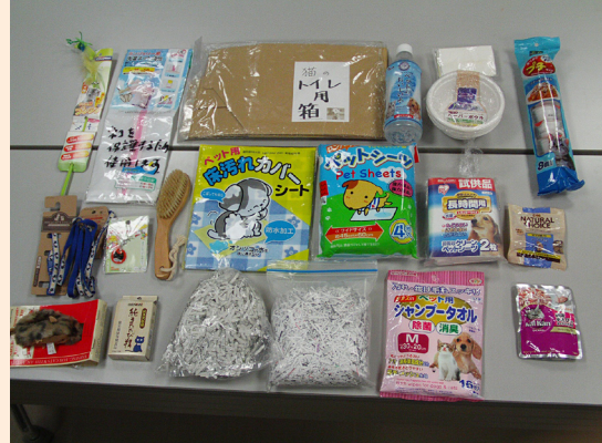
ペット用備蓄品 (猫用) の例