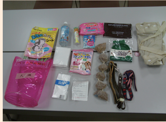
ペット用備蓄品 (犬用) の例