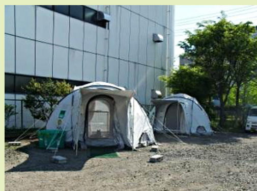
人とペットの同居テント（仙台市）